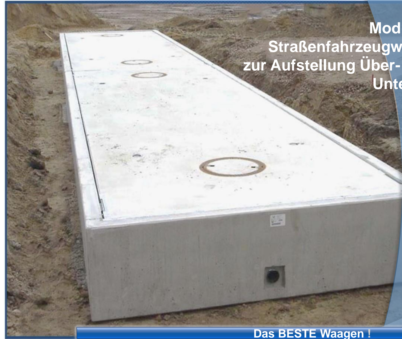
Modulare Straßenfahrzeugwaage zur Aufstellung Über- oder Unterflur

Produktinformation Nr. 1285e, SFW MODERNE, Stand 10.2023