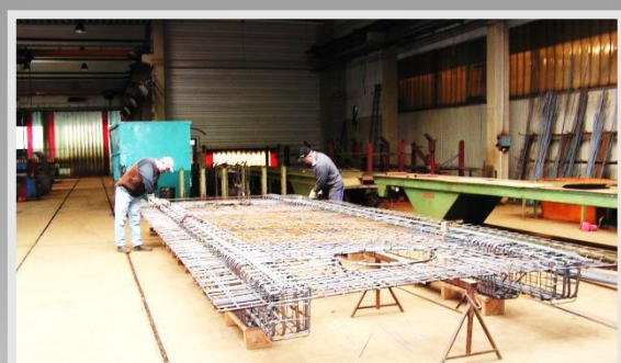
Güteüberwachte Produktion Handgefertigte Bewehrung