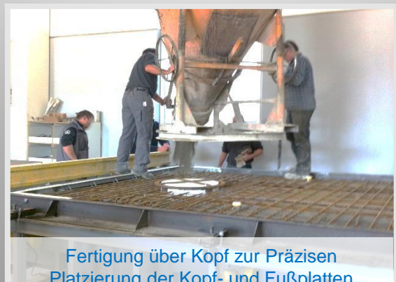
Fertigung über Kopf zur Präzisen Platzierung der Kopf- und Fußplatten