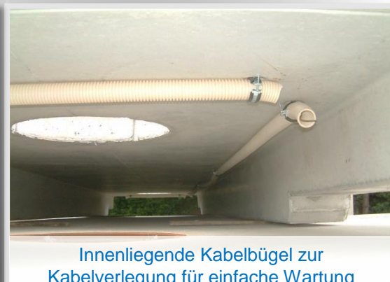
Innenliegende Kabelbügel zur Kabelverlegung für einfache Wartung