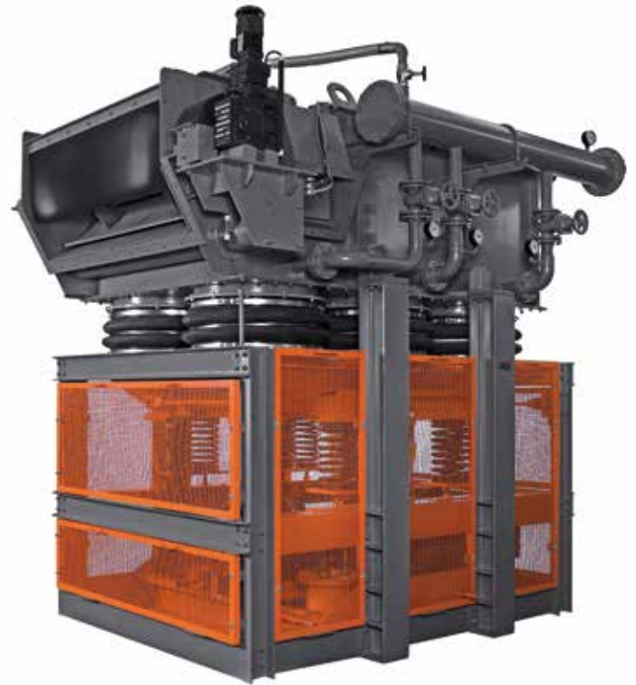
Schwingsetzmaschine Typ SK

Die Dichtesortierung ist ein essentieller Bestandteil in der Aufbereitung von Mineralien und im Recycling. Bei der Sortierung nach Dichte (besonders bei Stoffen mit kleinem Dichteunterschied) ist ein einfaches Aufspülen im Gegenstromverfahren für eine wirksame Trennung meistens nicht ausreichend. Vielmehr ist die senkrecht pulsierende Strömung durch das Setzbett erforderlich. Der mechanische Exzenterantrieb versetzt den mit Wasser gefüllten Oberkasten in harmonische Schwingungen, das Wasser pulsiert somit im Rhythmus der Schwingungen und leistet die für die Sortierung erforderliche Hubarbeit.