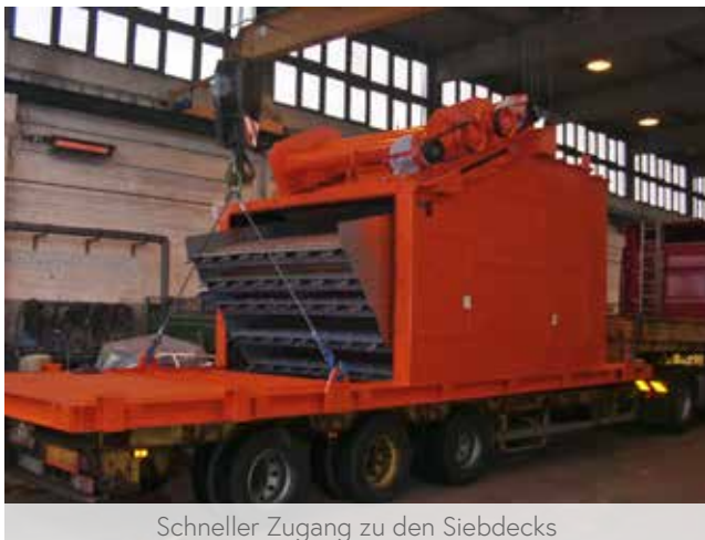
Schneller Zugang zu den Siebdecks

Die SIEBTECHNIK Siebmaschine Typ HN hat den Vorteil, dass die Lagerung des Antriebs außerhalb der feststehenden Staubschutzverkleidung und damit außerhalb des Hitzebereichs angeordnet ist. Heißes Splittmaterial mit Temperaturen von bis zu 450 °C wurde mit diesem System in zahlreichen Einsätzen zuverlässig gesiebt.