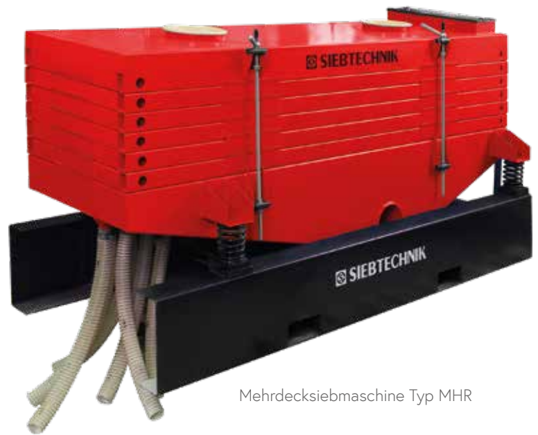
Mehrdecksiebmaschine Typ MHR

Die Versuchssiebmaschine mit einer Größe von 500 x 1400 mm mit bis zu 7 Decks steht im Technikum in Mülheim a.d. Ruhr oder als Mietsieb für Kundenversuche zur Verfügung.