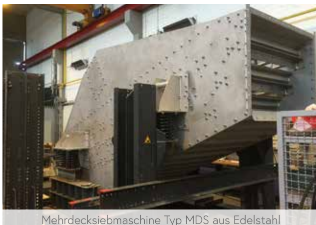
Mehrdecksiebmaschine Typ MDS aus Edelstahl

Für die Vorabscheidung, Anreicherung und Klassierung siebschwieriger mineralischer Schüttgüter. Auch bei relativ hohem Grenzkornanteil empfehlen wir unsere Mehrdecksiebmaschinen mit bis zu 5 Siebdecks übereinander. Die überwiegend monogranulare Absiebung, bedingt durch besonders im unteren Bereich sehr steile Siebdeckneigung, erlaubt hohe spezifische Siebleistungen und gute Klassiergenauigkeit auch bei kleinen Sieböffnungen. Der Werkstoff Edelstahl kann alternativ zum üblichen Normstahl gewählt werden.