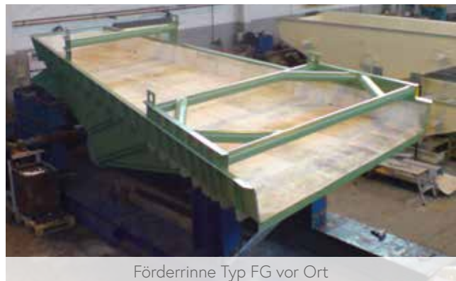
Förderrinne Typ FG vor Ort

Verschiedene Größen der Doppelunwuchtgetriebe erlauben eine ausgezeichnete Abstimmung auf Ihren spezifischen Anwendungsfall. Die Wuchtmassen und Drehzahlen sind in Stufen einstellbar, wodurch sich die Schwingweite und Beschleunigung der Maschine entsprechend den produktspezifischen Anforderungen optimal anpassen lassen. Unsere SIEBTECHNIK Doppelunwuchtgetriebe sind schnell und einfach zu montieren und bieten eine hohe Verfügbarkeit der Förderrinne. Dieses Antriebskonzept empfehlen wir z.B. bei Produktverteilterinnen, die nachgeschaltete Siebmaschinen