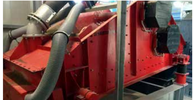
Unterdruckentwässerungssiebmaschine, Typ DWS-UE

Für besondere Anforderungen an die Restfeuchte von z.B. Sand ist unsere Unterdruckentwässerungssiebmaschine eine interessante Alternative. Sie liefert niedrigere Restfeuchten als Linerarschwingsiebmaschinen, die üblicherweise zur Entwässerung eingesetzt werden. Diese Maschine basiert auf dem Antriebskonzept „Doppelwellensiebmaschine“, da mit dieser Art der Schwingungserzeugung höhere Drehzahlen erreicht werden können. Höhere Drehzahlen kombiniert mit einem pneumatischen Unterdrucksystem haben deutlichen Einfluss auf eine niedrigere Restfeuchte.