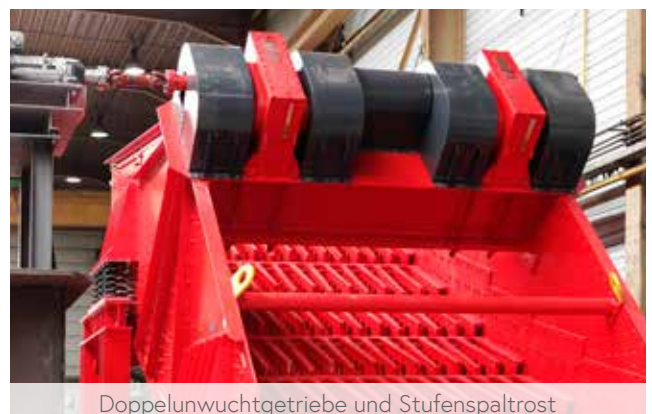
Doppelnuwuchtgetriebe und Stufenspaltrost

Ein SIEBTECHNIK Doppelnuwuchtgetriebe liefert das notwendige Arbeitsmoment für die gewünschte Schwingweite der Siebmaschine. Über die Anzahl und Form der Unwuchten ist es in Stufen einstellbar und kann über einen mit uns abgestimmten Drehzahlbereich betrieben werden.