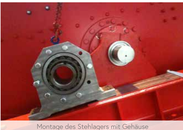
Montage des Stehlagers mit Gehäuse