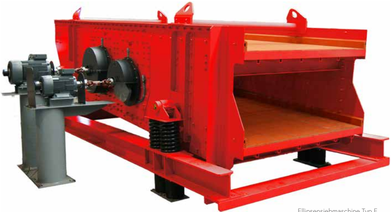
Ellipsensiebmaschine Typ E, elektronisch gesteuert