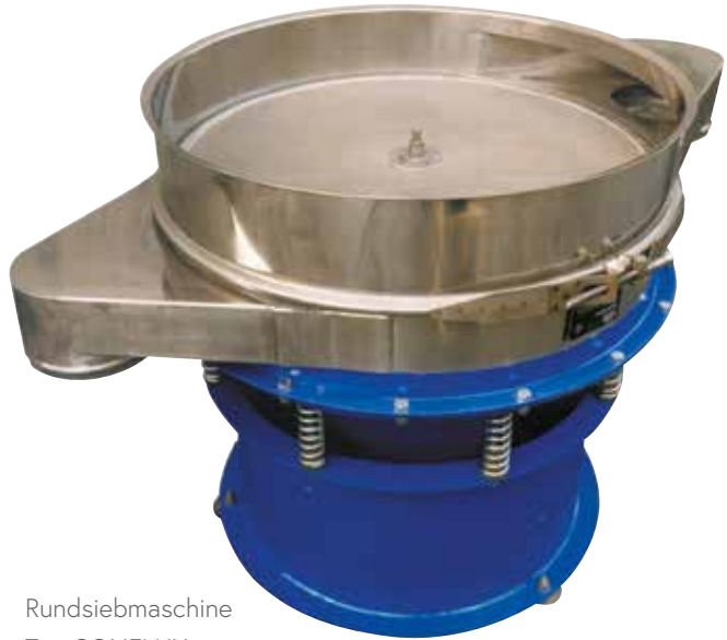
Rundsiebmaschine Typ CONFLUX

Je nach Anzahl der geforderten Korntrennungen lassen sich bis zu drei Siebtrommeln übereinander anordnen und so max. 3 Trennschnitte bzw. 4 Korngruppen erzielen. Überkorn und Unterkorn werden seitlich, an getrennten Austragsstutzen, abgezogen.