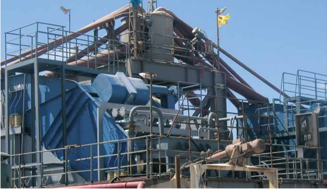
Getriebesieb Typ BHG, Bananensiebmaschinen in der Absiebung von Kalisalz in China