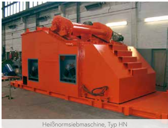
Heißnormsiebmaschine, Typ HN

In der brennerbeheizten Trockentrommel werden die Zuschlagstoffe, die etwa 80 – 90 Gew.-% der jeweiligen Asphaltrezeptur ausmachen, auf die erforderlichen Temperaturen erhitzt. Die Qualität der Asphaltschicht ist u. a. abhängig von der Bindemittelqualität und der richtigen Körnungszusammensetzung des mengenmäßig größten Anteils, der körnigen Zuschlagstoffe. Aus diesem Grund kommt der Siebmaschine eine besondere Bedeutung zu.