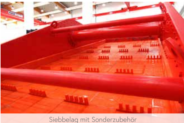
Siebbelag mit Sonderzubehör

Die Siebbodenneigung beträgt je nach Anforderung zwischen 10° und 30°, der Siebaufbau kann zwischen ein und drei Siebdecks umfassen.