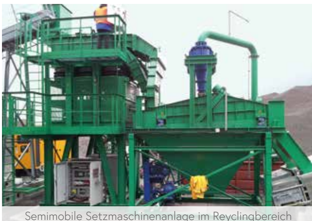
Semimobile Setzmaschinenanlage im Recyclingbereich