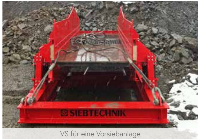
VS für eine Vorsiebanlage