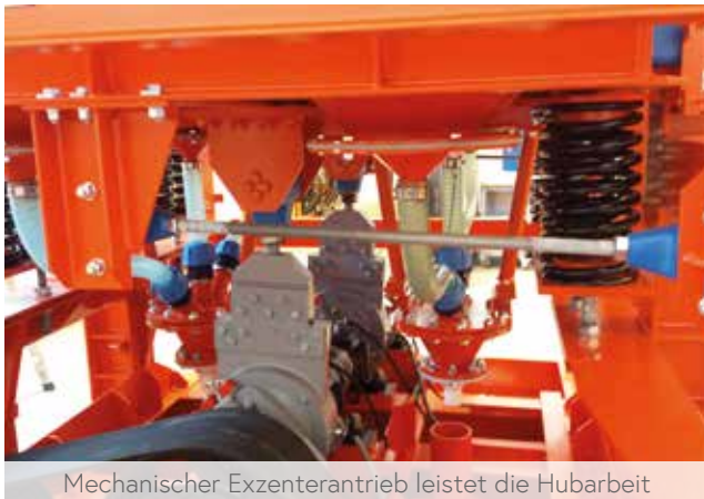
Mechanischer Exzenterantrieb leistet die Hubarbeit