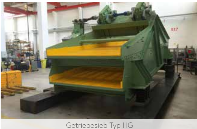
Getriebesieb Typ HG

Wir bauen Linearschwingsiebmaschinen mit oben oder unten angeordneten Antriebseinheiten für extreme Anforderungen. Dies gilt für breite Maschinen (bis 5,5 m Breite) oder für extrem grobkörniges Aufgabematerial (z.B. Granit mit Kantenlänge von ca. 1,2 m). Auch hohe Temperaturen des Aufgabematerials und die Forderung nach niedriger Restfeuchte sind mit diesen Maschinen realisierbar.