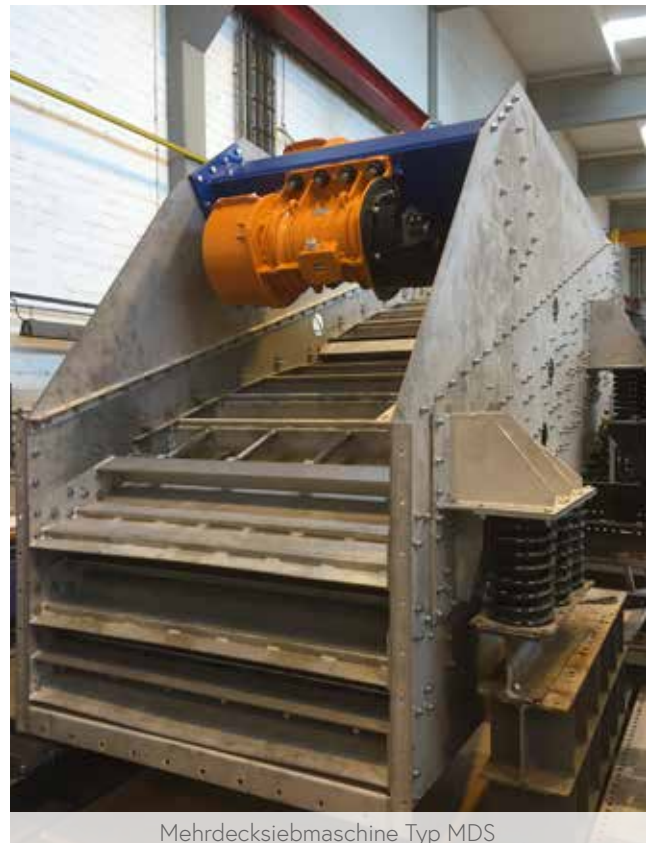
Mehrdecksiebmaschine Typ MDS