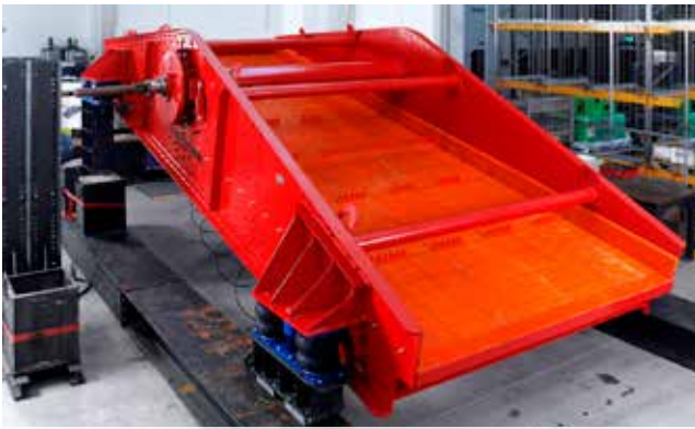
Kreisschwingsiebmaschine Typ V

Es sind freischwingende Siebmaschinen mit kreisförmiger Schwingbewegung, die auf Schraubendruckfedern verlagert sind. Siebkasten und Unwucht sind in ihren Massenverhältnissen optimal aufeinander abgestimmt. Auf diese Weise kann an allen Stellen der Siebmaschine eine harmonische Schwingbewegung auf das Siebgut übertragen werden. Drehzahl und Schwingweite der Maschine lassen sich produktspezifisch variieren und sorgen so für ein dauerhaft perfektes Absiebungsergebnis. Die robuste Bauweise unter Verwendung und Kombination von Standardbauteilen sorgt für eine hohe Flexibilität und ermöglicht kundenorientierte Lösungen. Darüber hinaus entstehen Maschinen mit wartungsarmer Laufzeit und langer Lebensdauer.