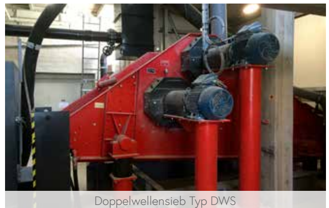
Doppelwellensieb Typ DWS

Zwei Unwuchtmotore werden gegenläufig betrieben. Die daraus resultierende Bewegung des Siebkastens ist somit linear – wie beim Getriebesieb oder beim Doppelwellensystem. Anwendungen finden diese eher kleineren Linearschwingsiebe z.B. bei der Entwässerung von Sand, Kies, Erz, Bohrspülung, Schlacke oder im Recycling.