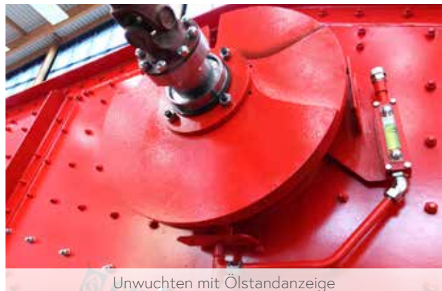
Unwuchten mit Ölstandanzeige

Die Maschinen können je nach Produkt für eine Schwingungsweite von 2 – 14 mm ausgelegt werden.