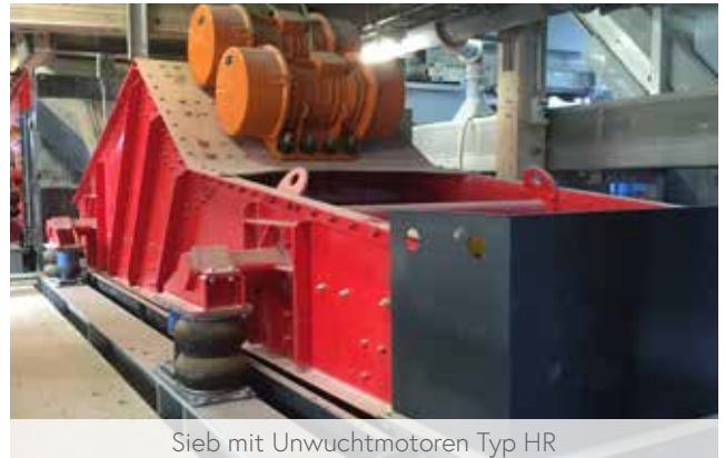
Sieb mit Unwuchtmotoren Typ HR

Dieses Antriebskonzept empfehlen wir z.B. bei der Brecherentlastungssiebung, d.h. als sogenanntes Vorsieb bei hoher Aufgabemenge oder grobem Trennschnitt.