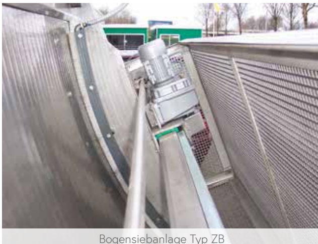
Bogensiebanlage Typ ZB

Sie bestehen aus einem stationären Gehäuse, welches mit einem konkav gekrümmten Siebbelag versehen ist.