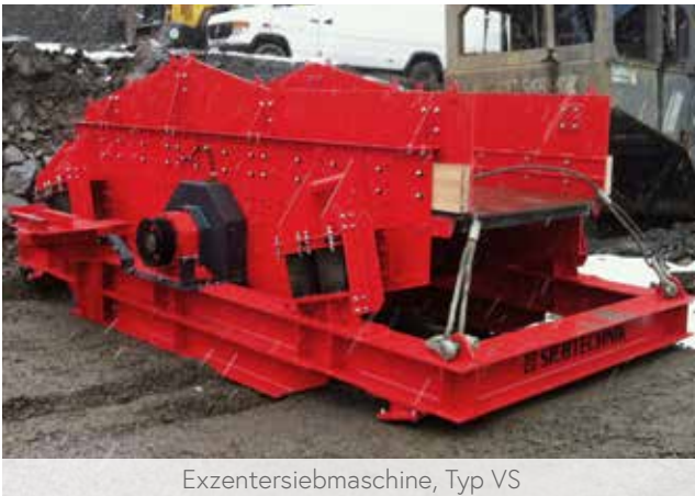
Exzentrersiebmaschine, Typ VS

Für eine effiziente Vorabsiebung mit Lochblechen oder Stufenrosten.