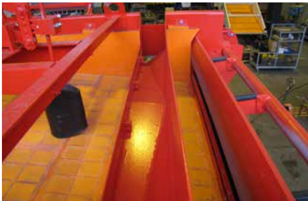
Schwimmer, Leichtgutrinne und Schwergutaustrag

Die SIEBTECHNIK Schwingsetzmaschine ist speziell konzipiert für das Trennen von Leichtgut aus Schwergut in Korngröße >1 mm. Hierzu zählen unter anderem das Abscheiden schädlicher Stoffe aus z.B. Sand und Kies, Schlacken, Bauschutt und kontaminierten Böden aber auch die Sortierung von verschiedenen Erzen. Erhältlich in verschiedenen Breiten und Längen für eine individuelle Anpassung an unterschiedliche Aufgabenmengen und für zahlreiche Einsatzbereiche.