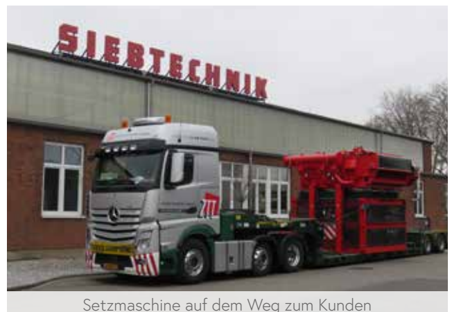
Setzmaschine auf dem Weg zum Kunden

Das Aufgabegut bewegt sich durch die Neigung des Setzbodens, die Hubarbeit und die Strömung des Oberwassers in Richtung Auslauf.